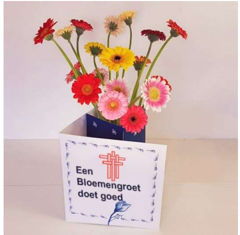
30-07: Wimmie Denekamp 06-08: Annelies Bunschoten