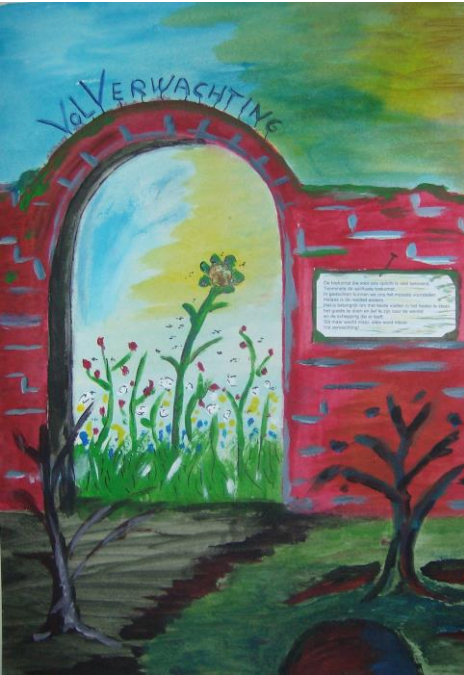
Hans Dekker (beeld) Mies van Steenberg (tekst): De toekomst die voor ons oplicht is veel belovend. Tenminste de spirituele toekomst. In gedachten kunnen we ons het mooiste voorstellen. Helaas is de realiteit anders. Het is belangrijk om met beide voeten in het heden te staan, het goede te doen en lief te zijn voor de wereld en de schepping die er leeft. Stil maar wacht maar, alles word nieuw..... Vol verwachting!