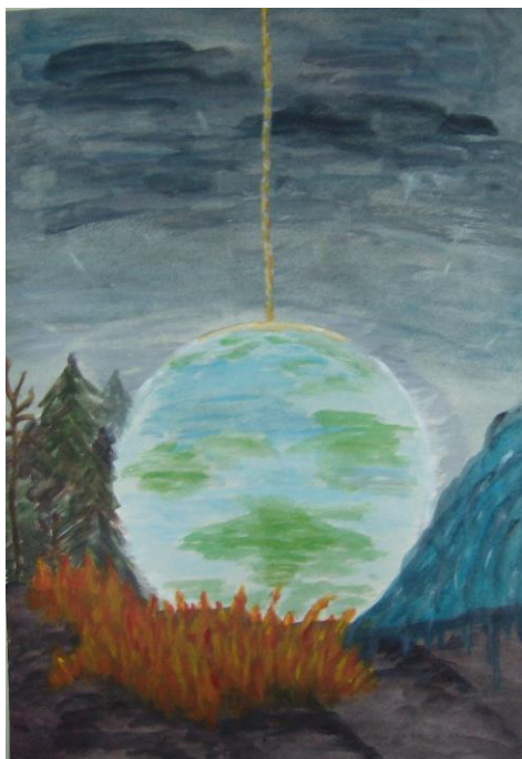
Toos van Essen Door toedoen van de mens zijn de 4 elementen (aarde, vuur, water en lucht) niet meer in evenwicht. De aarde wordt bedreigd en hangt aan een zijden draadje. Hoopvol is dat we er zelf wat aan kunnen doen om het tij te keren, dat we kunnen werken aan een betere, nieuwe wereld. God heeft mensen nodig om voor zijn schepping te zorgen!