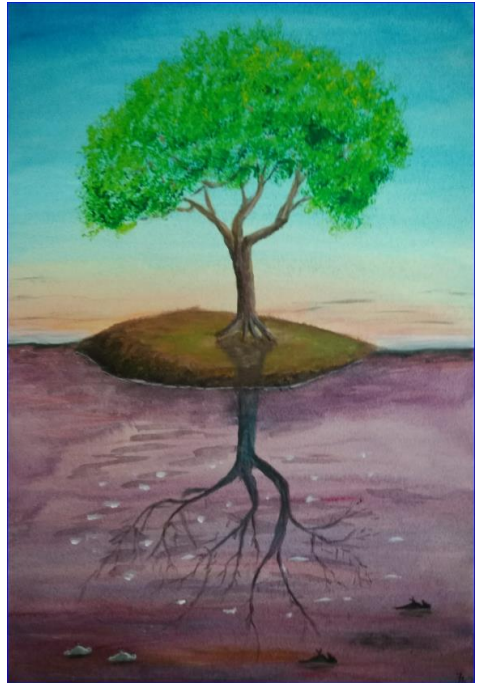
Jan Boot: De raven en de duiven (Luister naar: Jules De Corte - Het Land Van De Toekomst).

https://www.youtube.com/watch?v=Pg0DWDBO4z4