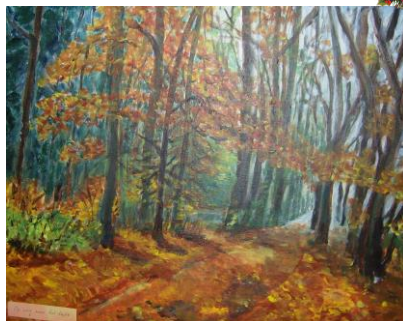
Dieke ten Hove-van Zwol: Op weg naar het licht.