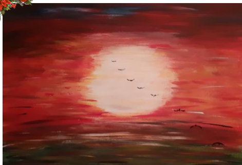
Annelies Bunschoten: Vrijheid op de mooie aarde waarvan je niet weet hoe die eruit ziet.