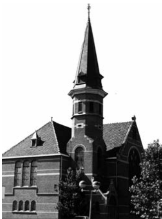
Noorderkerk, Amsterdamseweg 9 http://ede.protestantsekerk.net