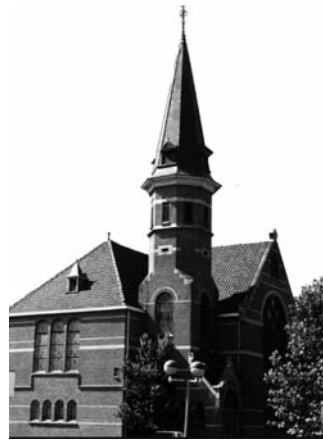
Noorderkerk, Amsterdamseweg 9 http://ede.protestantsekerk.net