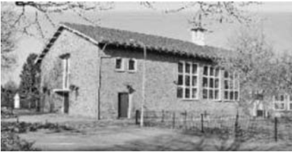
Taborkerk, Prinsesselaan 8, www.taborkerk.nl